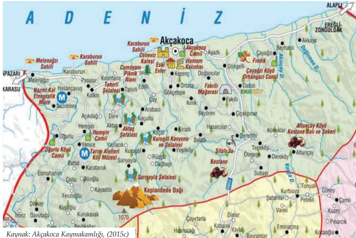
Şekil 1. Akçakoca'nın Turizm Haritası

Akçakoca ve çevresinin kuruluş tarihi kesin olarak bilinmemekle birlikte ve erken dönemleri hakkında da kesin bilgi bulunmamaktadır. Ancak bölgeden çıkarılan birtakım kalıntıların M.Ö. 1200 yıllarına tarihlendiği, bölgeye ilk gelenlerin ise Trakya yolu ile Anadolu'ya geçen Trak ve Frigler olduğu tahmin edilmektedir (Kara, 2014). Grek ve Yunanlı tarihçiler ise M.Ö. 650'lili yıllarda Yunanistan'ın Beotya-Kokonas kabilesinin bugünkü Akçakoca bölgesine gelerek Dia şehrini kurduklarını yazmaktadırlar (Kıngır, Akova ve Özkul, 2006). Türklerin Akçakoca