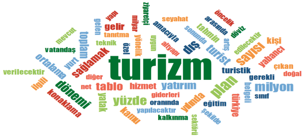
Şekil 1. Kalkınma Planlarına İlişkin Metin Belgelerinin Kelime Bulutu

Yukarıda gösterilen Şekil 1’de 11 kalkınma planından elde edilmiş 11 belgeye ilişkin kelime bulutu yer almaktadır. Bu 11 belge içinde 9272 kelimenin olduğu görülmüş ve toplam kelime içinde en az 15 tekrarı olan kelimeler dikkate alınmıştır. Buradaki amaç daha genel bir görsel elde etmektir. Bu çerçevede kelime bulutunda 61 kelimeye yer verilmiştir. Ayrıca, bazı ek almış kelimeler bir kelime altında birleştirilmiştir. Bu kelimeler arasında en fazla rastlanana 325 kelime ile turizm kelimesi olmuştur. Onu sırasıyla 100 kelime ile plan 74 kelime ile sayı ve milyon kelimeleri izlemiştir.